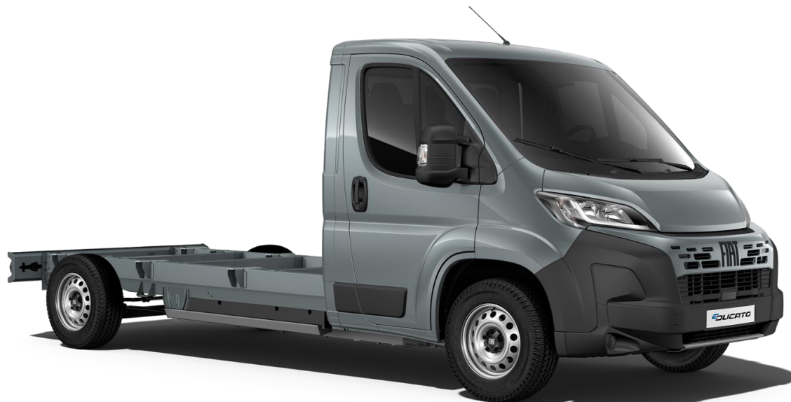
Cenník vozidiel e-Ducato Šasi platný od 20. 1. 2025