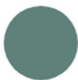
Šedá Lanzarote (385)