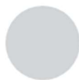
Šedá Artense (113)