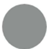
Šedá Expedition (676)