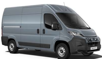
Šedá Ferro (691)