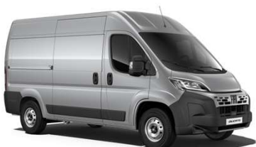
Šedá Artense (113)